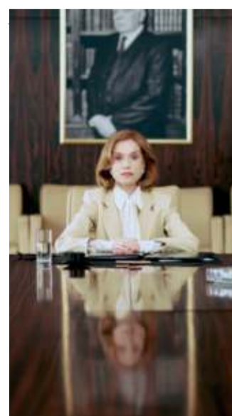
"La donna più ricca del mondo"