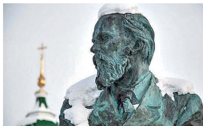
Una statua di Fedor Dostoevskij