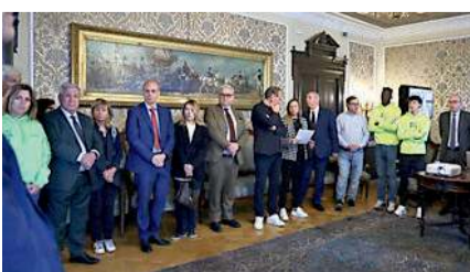
La presentazione DESTE / PAGINA 35