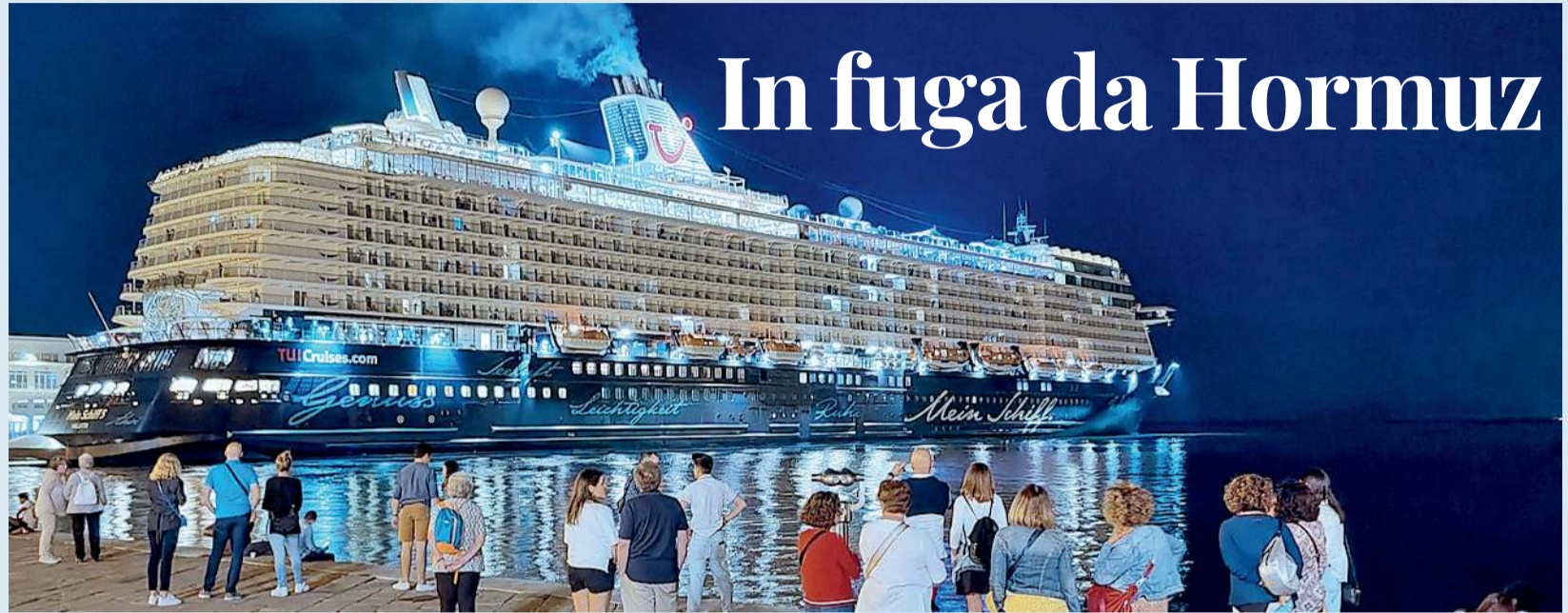
La nave da crociera Mein Schiff 4 durante una sosta in Stazione marittima a Trieste: per 50 giorni è rimasta imprigionata nelle acque del golfo Persico / PAGINA 6

GUERRA IN MEDIO ORIENTE: LA NAVE DA CROCIERA "MEIN SCHIFF 4" ERA BLOCCATA NEL GOLFO PERSICO. SUPERATO LO STRETTO, ORA FA ROTTA SU TRIESTE